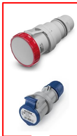
Acoples hembras Familias de productos: 313/318