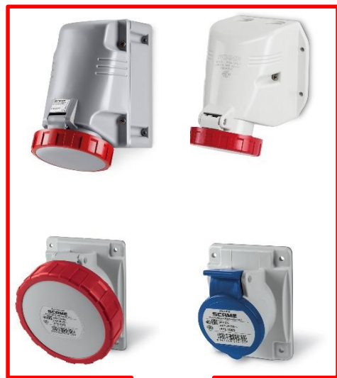
Bases murales y empotrables Familias de productos: 413/418/513/518

Productos complementarios en 16/32/63/125A IP44/54 - IP66/67/69