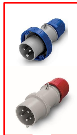
Fichas macho Familias de productos: 213/218