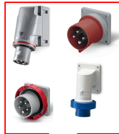
Bases conectoras Familias de productos: 242/243/245/246/247